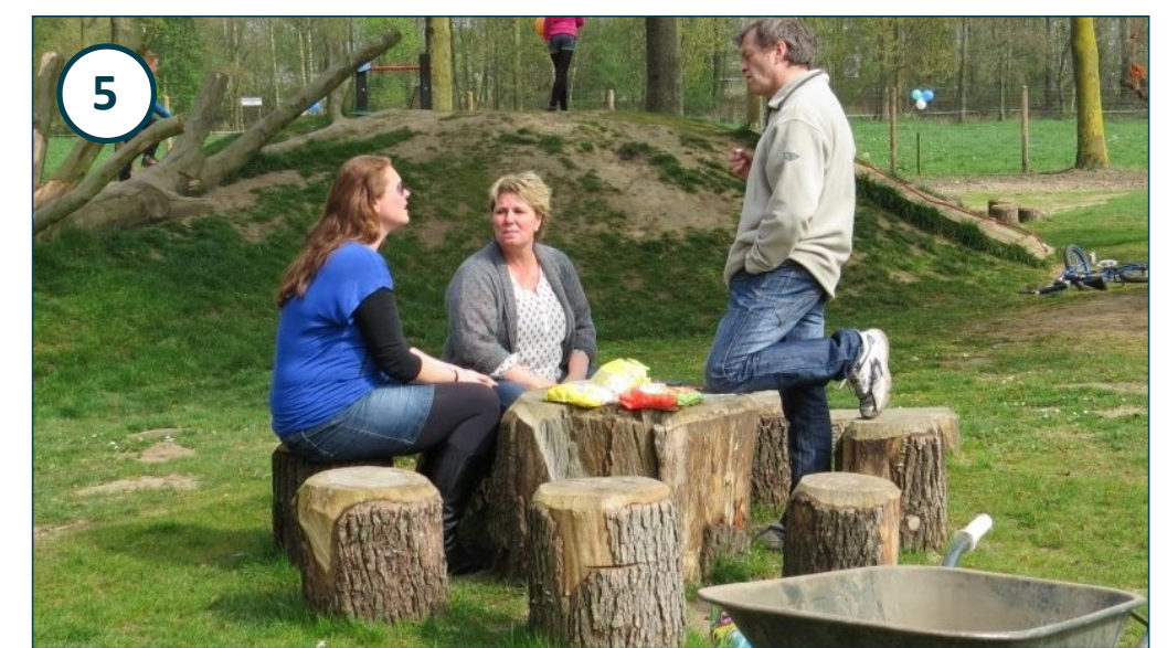
ontmoetingsplek van boomstronken