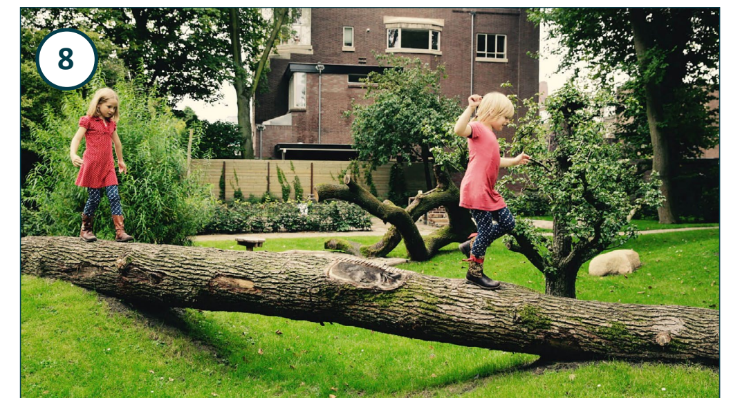
Balanceerstam over wadi