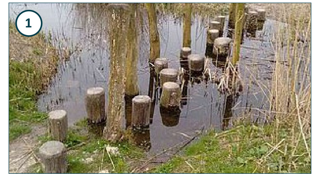
Stappalen hoog en laag door pool